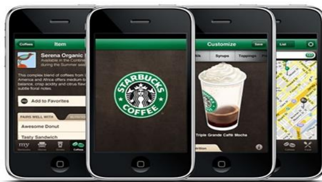
Рис.1.3. Мобільний додаток в Starbucks [21]

Мобільний додаток: Starbucks має мобільний додаток, який дозволяє клієнтам замовляти напої та їжу заздалегідь (рис. 1.3). Клієнти можуть вибрати місце та час, коли замовлення буде готове, і отримати його без черги.